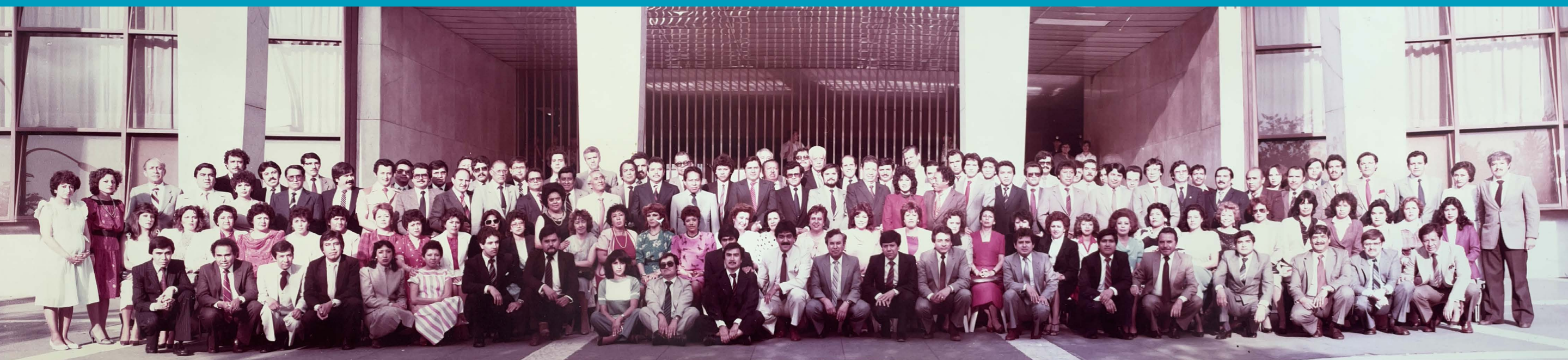
GENERACIÓN FUNDADORA. CURSO PROPEDEUTICO. CENTRO DE ESTUDIOS JUDICIALES. TRIBUNAL SUPERIOR DE JUSTICIA DEL DISTRITO FEDERAL, 1985.